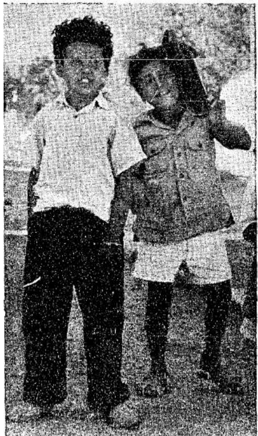
לְיֵלְדֵי בֵּית-שְׂאֵן יֵשׁ רַק בֵּית-סֵפֶר עֶמְמִי, וְחֹו לֹא.

נִכּוֹן, עִם הָעֵלִיָּה בָאוּ לְעִיר גַּם בְּעֵלֵי הַשְּׂכָלָה וְאֲנָשֵׁי מְקַבְּצוֹ, אִךְ הֵם עוֹזְבוּ בְּהוֹדְמָנוֹת הָרֵאשׁוֹנָה, וְמִי שֶׁלֹּא עוֹזֵב אוֹרֵז עִתָּה אֵת מְזוֹרוֹתָיו, וְמִי שֶׁלֹּא אוֹרֵז אוֹתָן — חוֹלֵם עַל הַשְּׂעָה שִׁיעֲשֶׂה זֹאת, וְמִי שֶׁכִּבְּרָ בֹא מִהַחוּץ לְעִבּוּד, מִשְׁאִיר אֵת מִשְׁפַּחְתּוֹ בְּמִקוֹם „חֲרָבוֹתִי“ יוֹתֵר. תְּהַלִּיךְ מְרַבֵּק: עוֹזֵב אֶחָד — הוֹלְכִים בְּעַקְבוֹתָיו שְׁנַיִם, וּבְעַקְבוֹת