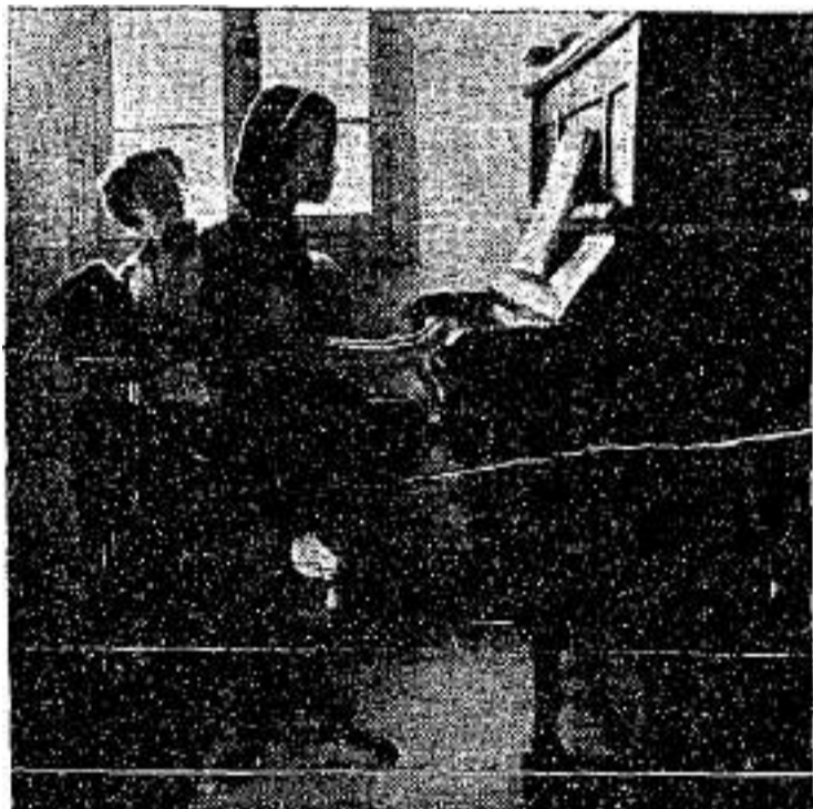
הַפְּסָנְתֵר הַיְחִידִי בְּעִיר וְהַמּוֹרָה — שְׁנֵיהֶם עוֹזְבִים

הַשְּׁנַיִם — אַרְבַּעַה. לְכָל אֶחָד הַסֵּבֵר מִשְׁלוֹ. אֹמֵר מוֹרָה בְּבֵית-הַסֵּפֶר הַמַּמְלֶכֶתִי: „אֲשֵׁתִי אֵינָה רוֹצָה לְהִשָּׂאֵר כָּאֵן, אִין לֹה חֲבֵרָה“. אִמְרַת עוֹלָה מִצְ'כָּיָה, אֵם לְשֵׁתִי בְּנוֹת בְּגִיל 13 ו־15: „נִצְטָרֵךְ לְעוֹזֵב, יֵשׁ רַק בֵּית-סֵפֶר יְסוּדִי בְּמִקוֹם“. מוֹסִיקָה קְלָאָסִית זֶרֶה מְאֹד לְאוֹרַת בֵּית-שְׂאֵן וּבְכָל זֹאת — הוֹלְכִים בְּכַיִשׁ וְשׁוֹמְעִים סוּגָטָה שֶׁל שׁוֹפֵן מְנוּבָנֵת עַל פְּסָנְתֵר. הַמּוֹרָה הַיְחִידָה לְפְסָנְתֵר בְּכָל עִמְק בֵּית-שְׂאֵן, וְהַפְּסָנְתֵר הַיְחִידִי בְּעִיר — שְׁנֵיהֶם עוֹזְבִים. אִמְרַת הַמּוֹרָה: „בְּעֵלִי לֹא מֵצָא פְּרִנְסָה מִתְּאִימָה כָּאֵן. עֲכָשִׁיו הוּא עוֹבֵד עַל „נִגְבָּה“ וְאֵנְחָנוּ עוֹבְרִים לְגוֹר בְּחִיפָה“. חֶבֶל לֹה לְעוֹזֵב אֵת בֵּית-שְׂאֵן, הִיא אֹמְרַת, הִיא אוֹהֶבֶת אֵת הָעִיר וְאֵת הַסְּבִיבָה וְאֵת דִּירָתָה בְּבֵית הָעֵרֵבִי. הַתְּרַגְלוֹ הָאֲנָשִׁים לְמִקוֹם, לְמַדוֹ לְאוֹהֵב אוֹתוֹ עַל כָּל מִגְרַעוֹתָיו, רֹאִים אֵת עֲצַמֵּם וְתִיקִים וּמְבוֹסָסִים לְעוֹמֵת הָעוֹלָם הַחֲדָשִׁים, הַבָּאִים עִתָּה מִמְּרוֹקוֹ לְמַעֲבַרַת בֵּית-שְׂאֵן, וּבְכָל זֹאת — עוֹזְבִים.