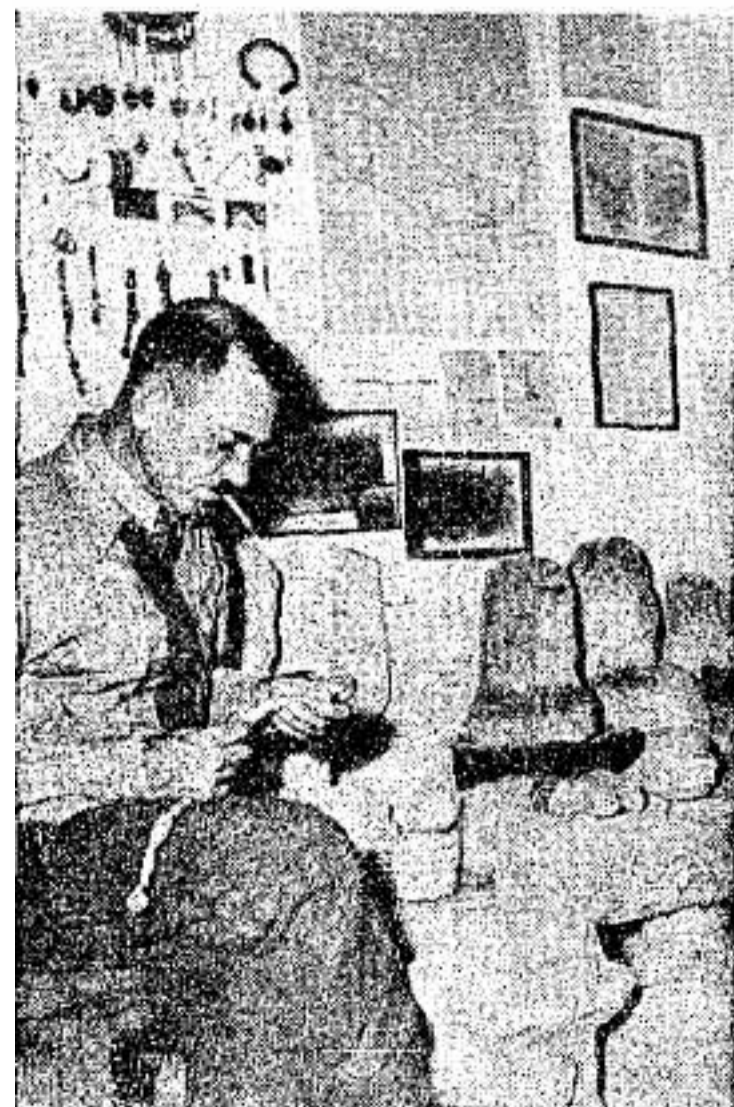
בֵּית-נְכוֹת דְּחוּס וּמְנַזְלָה הַחוֹלָם עַל חֲפִירוֹת.