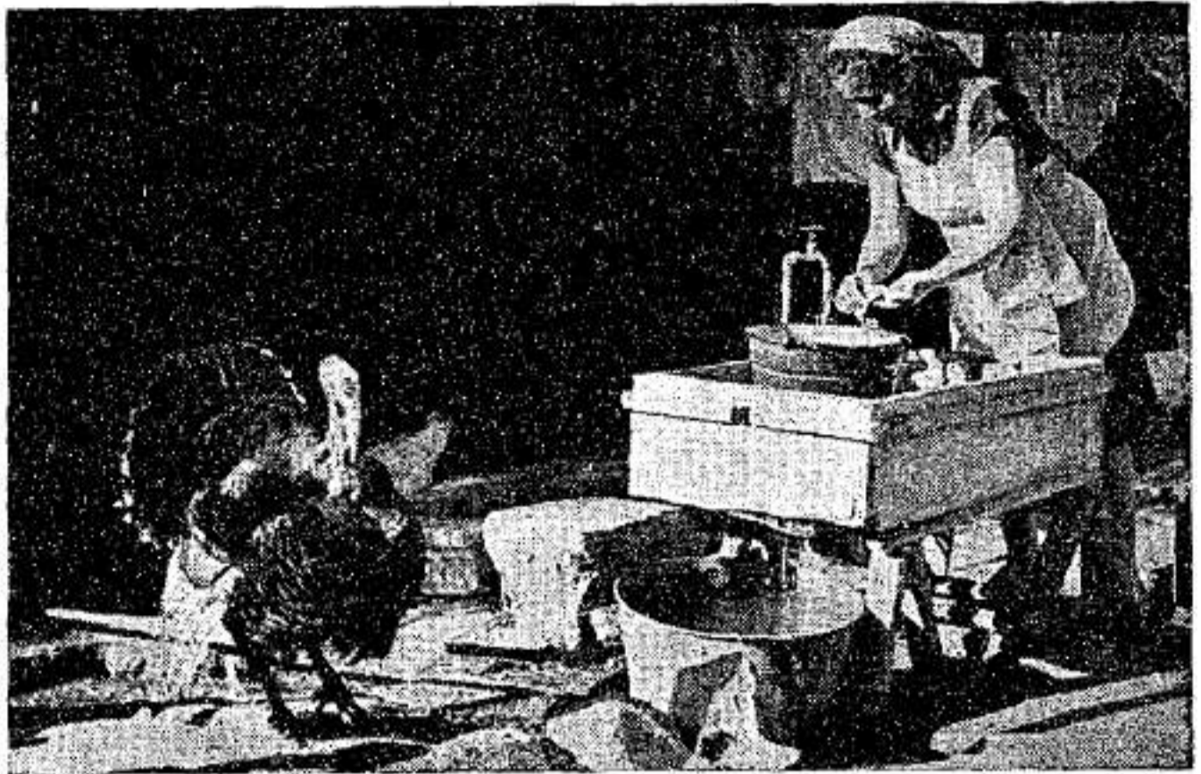
אֶשֶׁר לְהַסְמֵד גַּם בְּבֵית שְׂאֵן, אִמְרַת בְּעֵלַת מְרַגְלוֹי הָדוּ, עוֹלָה מִצְ'כָּיָה